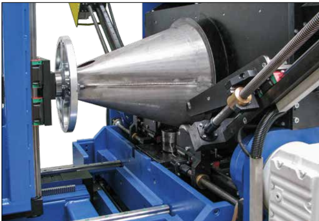
Bearbeitung von konischen Rohren