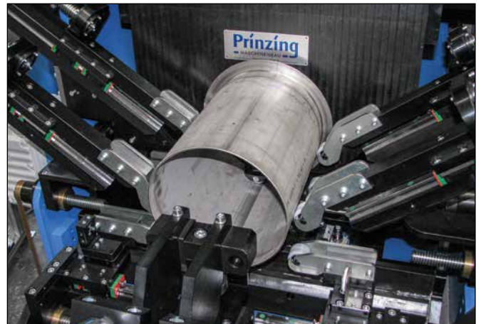
Bearbeitung von zylindrischen Rohren